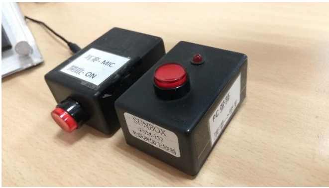
sanako 教室為影像廣播鈕